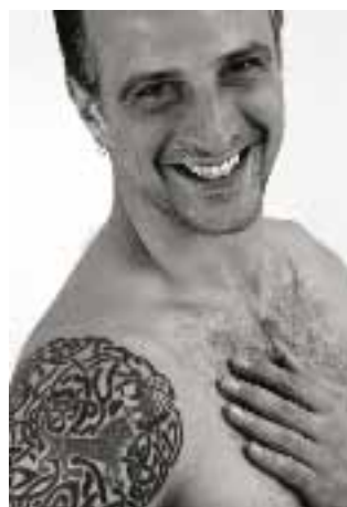
Tarjetas de Emoción 2

Retroalimentación: usted puede utilizar las Tarjetas de Emoción para la retroalimentación al final de su seminario. Preguntas de sugerencia: "¿Cuál fue uno de los resultados más importantes para usted y cuál imagen representa este resultado?" "¿Cuál será su siguiente paso?" "¿Qué va a poner en práctica en su vida diaria?" "Escoja la imagen que más representa esto". Con la ayuda de la Tarjeta de Emoción elegida, cada participante brinda retroalimentación. Mas variaciones se describen en las instrucciones.